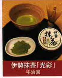
伊勢抹茶「光彩」 宇治園