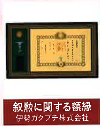
叙勲に関する額縁 伊勢カクフチ株式会社