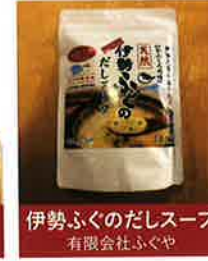
伊勢ふくのだしスープ 有限会社ふくぐや