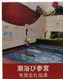
潮浴び参宮 有限会社旭湯