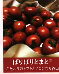
ぱりぱりとまと® こだわりのトマトとメロン作り谷口