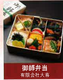
御師弁当 有限会社大喜