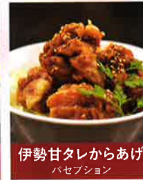
伊勢甘タレからあげ パセプション