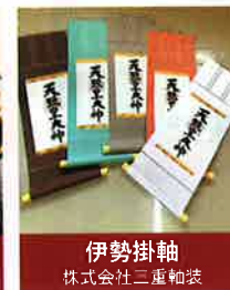
伊勢掛軸 株式会社二重軸装