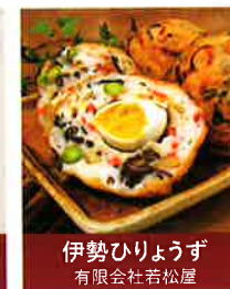
伊勢ひりょうず 有限会社若松屋