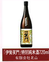
「伊勢笑門」特別純米酒720ml 有限会社北山