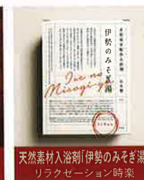
天然素材入浴剤「伊勢のみそぎ湯」 リラクゼーション時楽