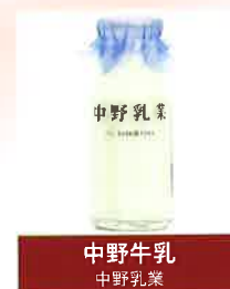
中野牛乳 中野乳業