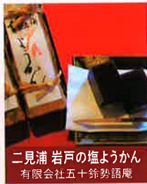
二見浦 岩戸の塩ようかん 有限会社五十鈴勢語庵