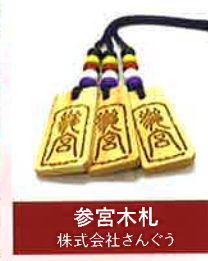
参宮木札 株式会社さんくう