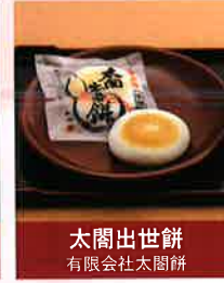
太閤出世餅 有限会社太閤餅