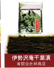
伊勢沢庵干葉漬 有限会社林商店