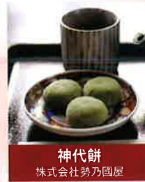
神代餅 株式会社勢乃園屋