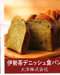
伊勢茶デニッシュ食パン 大洋株式会社