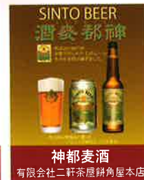
神都麦酒 有限会社二軒茶屋餅角屋本店