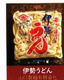
伊勢うどん 山口製麺有限会社