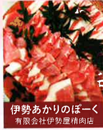
伊勢あかりのぼーく 有限会社伊勢屋精肉店