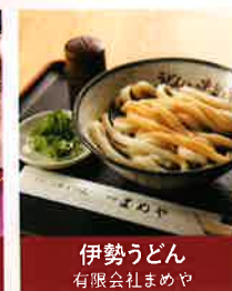
伊勢うどん 有限会社まめや