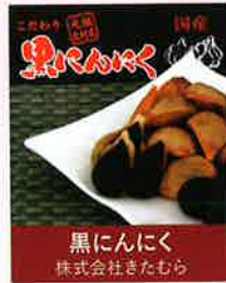
黒にんにく 株式会社きたむら