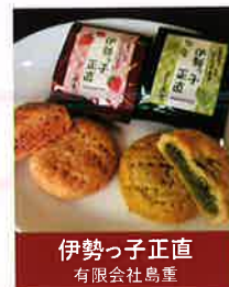
伊勢っ子正直 有限会社鳥重