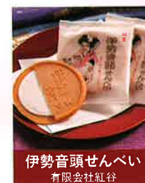
伊勢音頭せんべい 有限会社缸谷