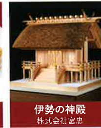
伊勢の神殿 株式会社宮忠