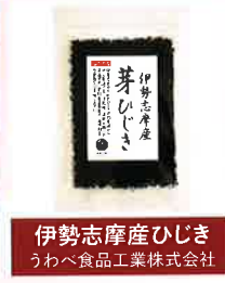
伊勢志摩産ひじき うわべ食品工業株式会社