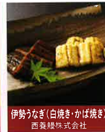
伊勢うなぎ(白焼き・かば焼き) 西養鯉株式会社