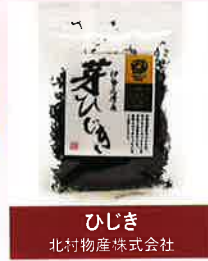
ひじき 北村物産株式会社