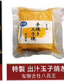
特製 出汁玉子焼き 有限会社八百正