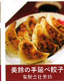
美鈴の手延べ餃子 有限会社美鈴