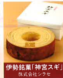
伊勢銘菓「神宮スギ」 株式会社シラセ