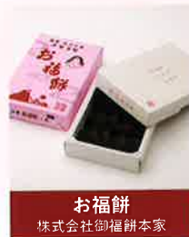
お福餅 株式会社御福餅本家